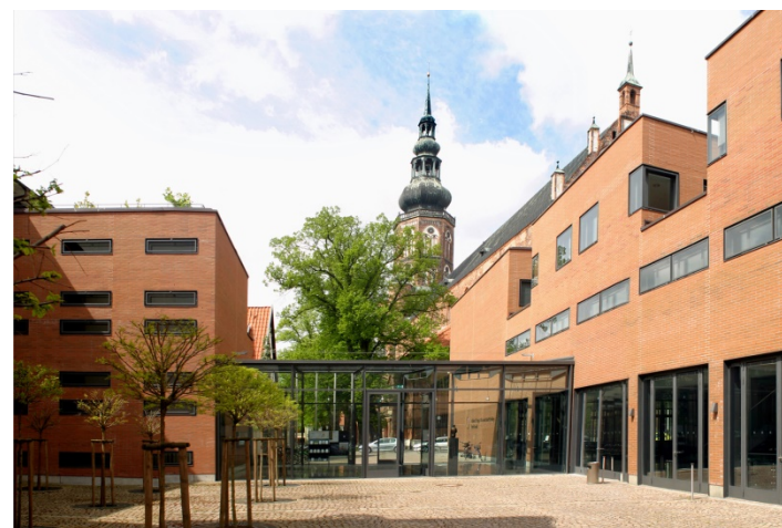
Alfried Krupp Wissenschaftskolleg Greifswald/Vincent Leifer

Alfried Krupp Wissenschaftskolleg Greifswald