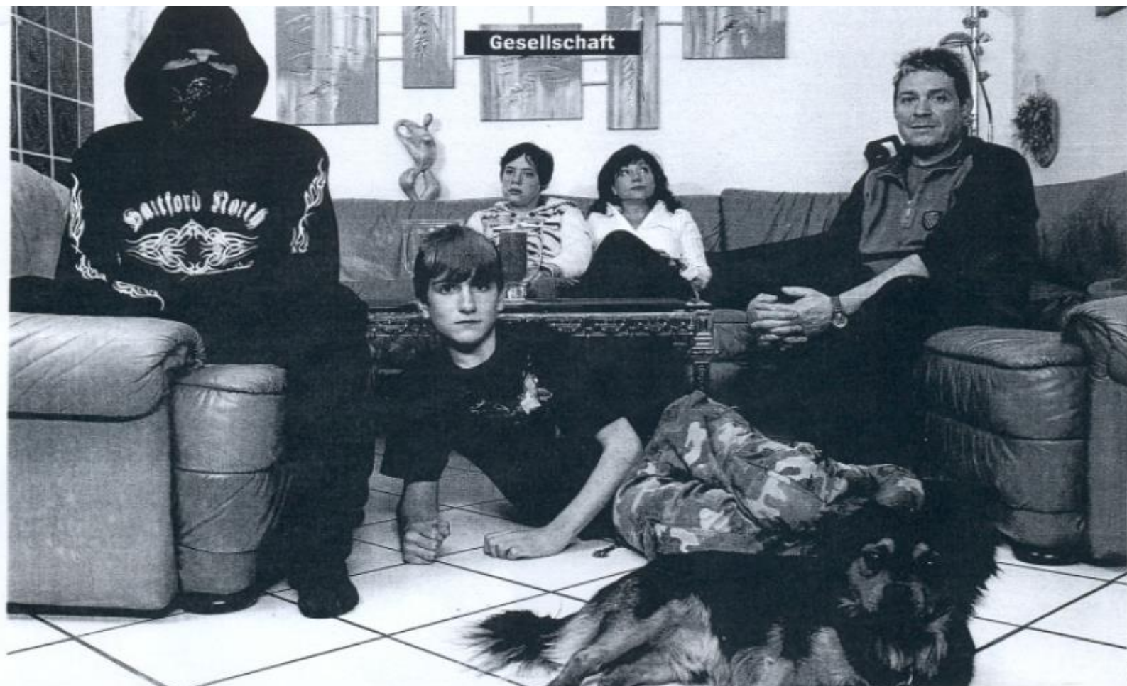
Gastfamilie Kobe, 16-jähriger Gastsohn (l.): Geht das? Heimisch werden bei Fremden, bei Spießern oder Bauersleuten?