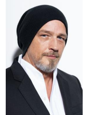
Torsten Sträter Komiker und Autor